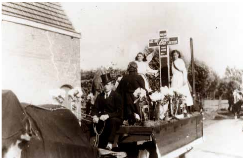
BEVRIJDINGSFEEST IN MADE 5 MEI 1945

Met z'n allen gaan ze die richting in. Na het aanbellen wordt er opgedaan. Als de bewoners, vermoedelijk de familie Huijgens horen, waarvoor ze komen, volgt er een allerhartelijkste ontvangst. Ze zijn weliswaar ook maar net bevrijd en hebben veel schade geleden, maar er is altijd plaats. Als ze op de hoogte komen van moederstoestand, maken ze binnen de kortste keren een bed voor haar klaar. Alle Knoopjes krijgen te eten en voor iedereen wordt een slaapplekje gevonden. Er volgt een rustige nacht. Na het opstaan blijkt dat er tocht geen tegenaanval door de Duitsers is ingezet en Made dus voorlopig weer