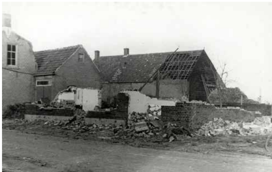
VERWOESTE HUIZEN IN MADE, 1944-45

De aanval op Made wordt over een breedfront uitgevoerd door een Pools-Britse gevechtsgroep met pantserwagens, tanks, bren-gun carriers met zware machinegewe-