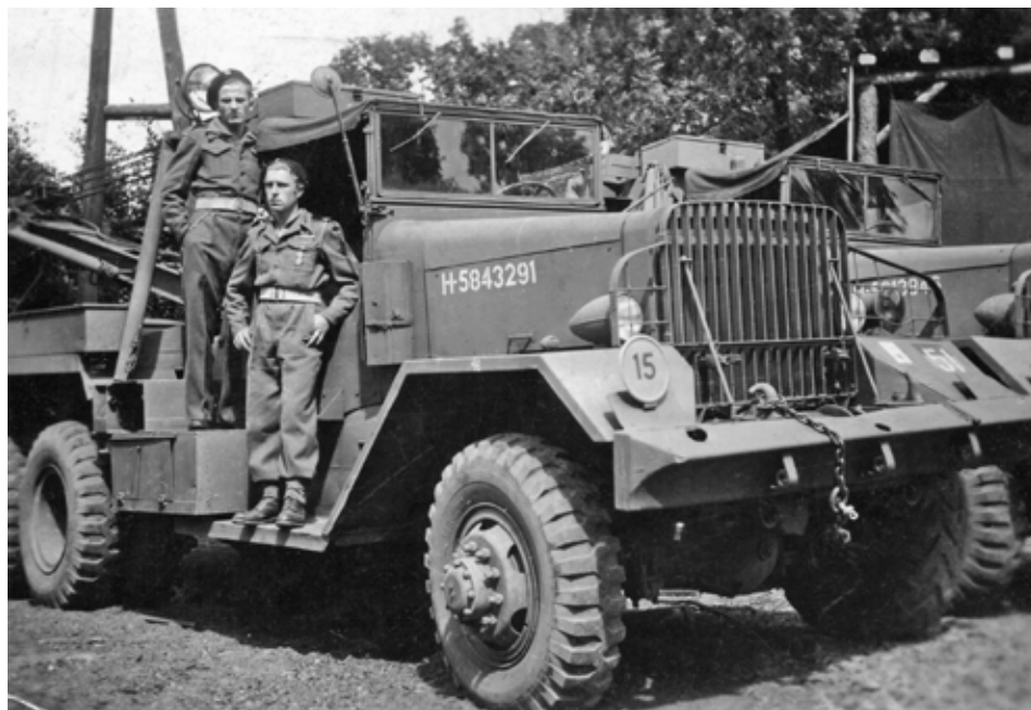
LINKS KAZIMIERZ MATEJCZYK, AUTOMONTEUR IN OPLEIDING, 1944-'45

Op 14 november 1946 wordt Kazimierz Matejczyk in Wilhemshafen gedemobiliseerd. Al snel blijkt dat een terugkeer naar het eigen land niet