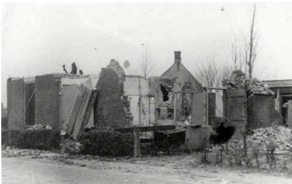
SCHADE IN MADE, 1944-'45

Brengun-carriers, een lichtbepantserd rupsvoertuig. Het eerste peloton vlammenwerpers valt de voorkant van de huizen en boerderijen in de hoofdstraten aan om de Duitsers er uit te verdrijven. Het tweede en vierde peloton schakelen de aan de achterzijde vluchtende Duitsers uit.