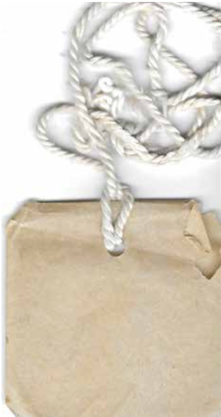
ENVELOPJE MET TOUWTJE VOOR KAARTJE, 1940-'44 (COLLECTIE CHRIS KNOOP)