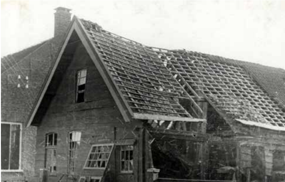
KAPOTGESCHOTEN HUIZEN IN MADE, 1944'45

Daarbij kwam nog een maandenlange ligging aan de frontlijn van het bevrijde Zuiden. Dit had grote gevolgen voor de veiligheid en het dagelijks leven. Tot herstel en wederopbouw kwam het tot ver in 1945 niet of nauwelijks. Publieke voorzieningen waren kort na de bevrijding niet meer voor handen: riolering en wegen waren vernield, trein en bus niet te bekennen, telefoon werkte niet en ook elektriciteit kwam maar nauwelijks beschikbaar. De avondklok bleef en tijdens de koude winter van 44-45 was er grote behoefte aan kleding, dekens, schoeisel, brandstof en huisvesting 40 .