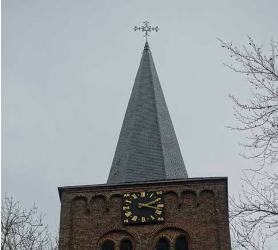
ACTUELE FOTO VAN TOREN MET KRUIS, MAART 2024, COLLECTIE HEEMKUNDEKRING DONGEN FOTO: PIET WILLEMSE