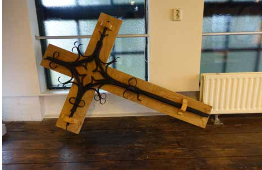
ORIGINELE 15E EEUWSE TORENKRUIS IN TIJDELIJKE OPSTELLING VAN MUSEUM DE LOOIERIJ, 2023, COLLECTIE MUSEUM DE LOOIERIJ.

Toch heel bijzonder dat diverse generaties uit dezelfde familie hun ambachtelijke kunst ten dienste van de Dongense gemeenschap hebben gesteld.