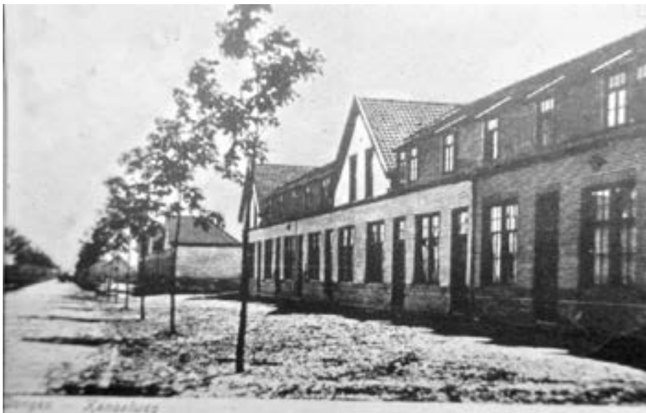
Foto van eerste woningwetwoningen in de toenmalige Kanaalweg (de huidige Wilhelminastraat)