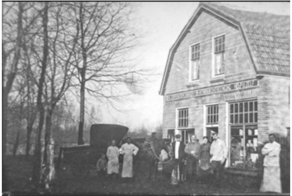
Foto van de coöperatieve bakkerij Help Uzelf in de Nieuwstraat (omstreeks 1925)

De patroon van een ander bestuurslid - een molenaarsknecht - wordt bedreigd dat er niets meer te malen wordt gegeven als de knecht niet wordt ontslagen. Daar tegenin dreigen de looiers dat als de knecht ontslagen wordt de molenaar niets meer van hen te malen krijgt. Al met al volop commotie in Dongen.